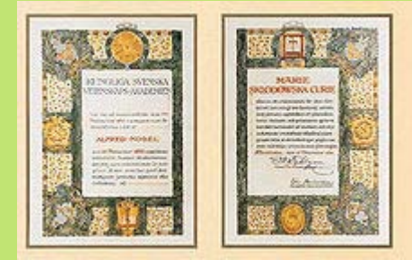
Dyplom Nagrody Nobla z 1911 roku