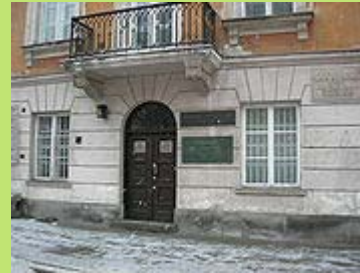
Muzeum Marii Skłodowskiej-Curie w Warszawie